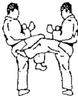
uchi ashibo uke