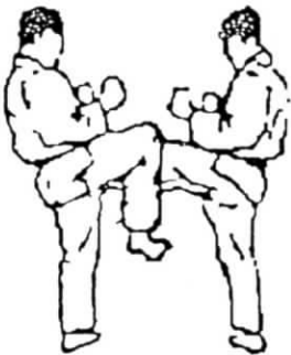
soto ashibo uke

KUZURE ASHIBO UKE: OTRAS FORMAS DE BLOQUEOS CON LAS PIERNAS