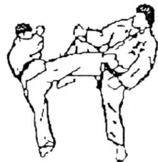
kuzure ashibo uke